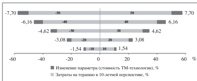
Рис. 2. Результаты детерминированного однофакторного анализа чувствительности изменения стоимости терапии АГ в 10-летней перспективе (изменяемый параметр – стоимость ТМДК в расчете на 1 пациента в год, руб.); диаграмма Торнадо.

Примечание. Изменяемый показатель – стоимость ТМДК, 21 220,56 руб. (по данным на 2018 г.)