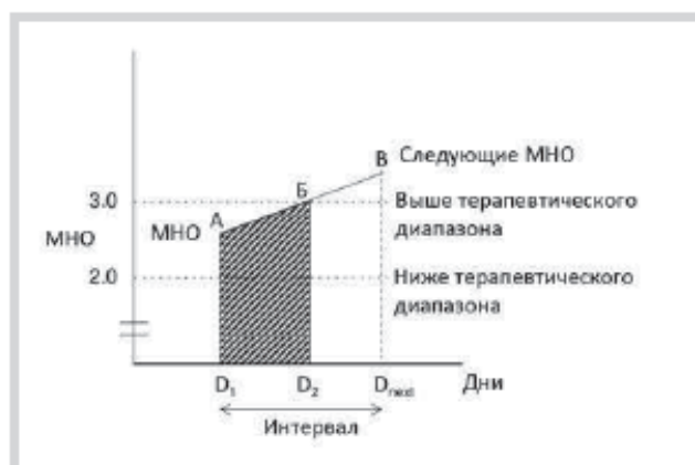
Рис. 2. Определение времени нахождения МНО в пределах терапевтического диапазона.

А — МНО 2,5 в первое измерение ( D_1 ); В — день, до которого МНО оставалось в пределах терапевтического диапазона ( D_2 ); В — МНО 3, на следующем визите ( D_{след} ). Дни в диапазоне, когда МНО находилось еще в терапевтическом диапазоне = D_2 - D_1 (здесь: 15 - 0 = 15 ). Время в терапевтическом диапазоне (TTR) = дни в диапазоне, когда МНО находилось еще в терапевтическом диапазоне, деленное на интервал, умноженное на 100% (здесь: интервал 30 дней. TTR = 15:30 \cdot 100 = 50\% ).