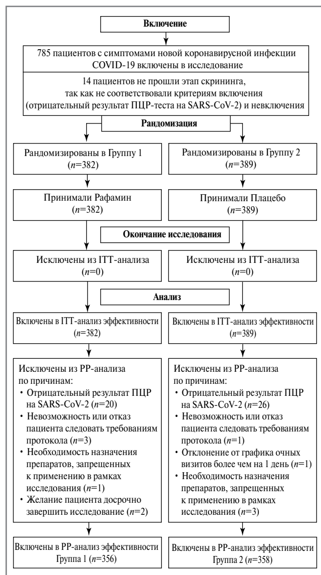
Рис. 1. Движение пациентов в ходе исследования.