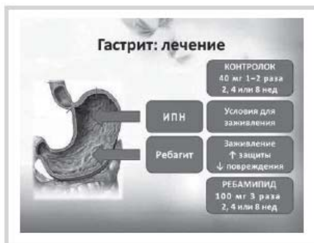
Рис. 2. Схема лечения ХГ.

ных H. pylori , использование различных ИПН в эрадикационных схемах является вполне легитимным. В отсутствие инфицированности H. pylori единственным ИПН, который может быть назначен по показаниям, отраженным в инструкции по применению, является пантопразол (контролок) и только при эрозивном гастрите. При любых вариантах ХГ может применяться ребагит (ребамипид), поскольку он имеет данные показания и, по результатам многих исследований, проведенных в последние годы, является одним из лучших препаратов выбора в восстановлении СОЖ и других отделов пищеварительной системы. Как отмечалось ранее, его эффективность доказана при дефектах слизистой оболочки различного генеза — эрозивных и неэрозивных гастритах, язвенной болезни, патологии, вызванной присоединением НПВП (рис. 2).